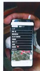
圃場ごとのデータ管理